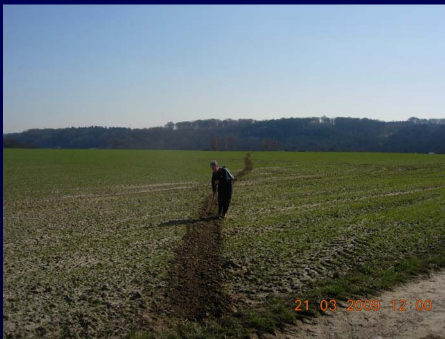
Traçage du sentier n°63