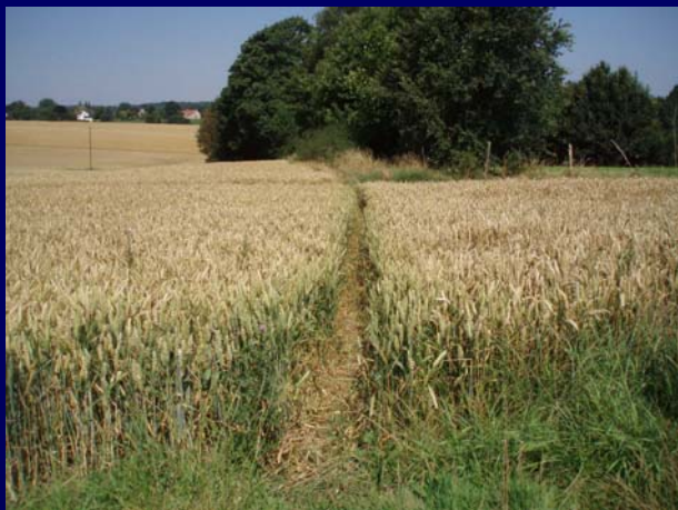
Tracé non officiel du chemin n°32