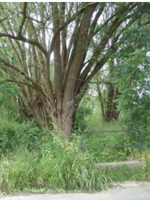
4. Le ri de la Cour des Moines