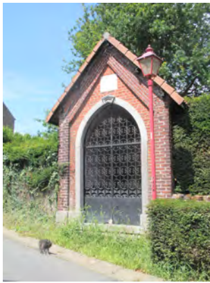
2. La chapelle St-Joseph