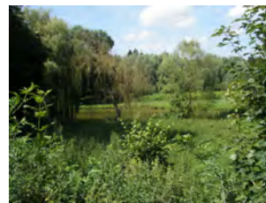
22. Le parc de la Dyle vu du pré-RAVeL