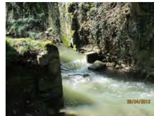
21. Ancienne retenue d'eau pour la forge Hens