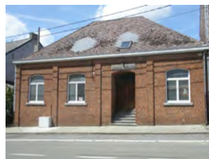
17. La salle Saint-Martin