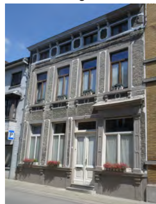
12. Façade au crêpi belge