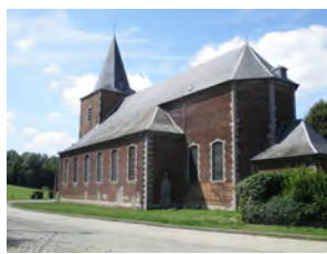
19. L'église de Ways et le presbytère attenant