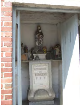
5. La chapelle N.-D. de Tongres