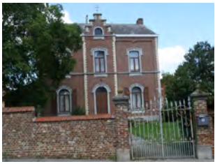
1. Le presbytère

Départ/arrivée: Place de Mercurey (Eglise de Vieux-Genappe)