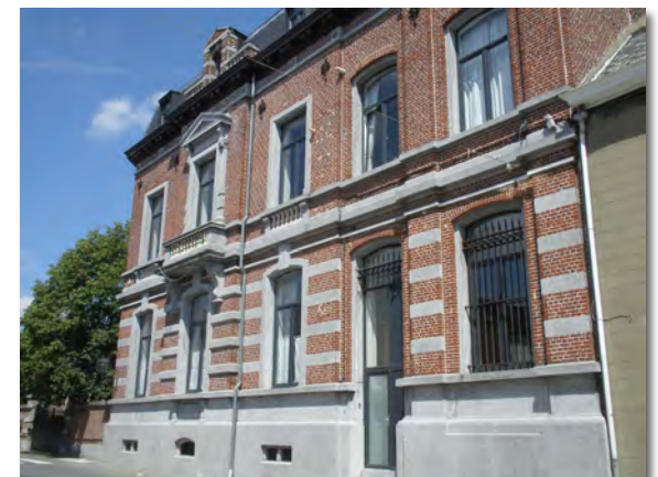
14. La maison du docteur Brigode