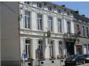
13. La maison Jottrand