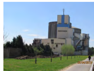
24. Les silos de l'ancienne sucrerie et le RAVeL