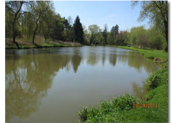
21. Le parc de la Dyle