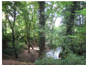
21. Méandre de la Dyle à la Cour Thomas