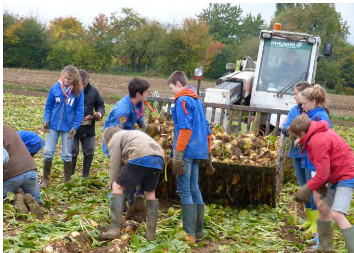
Tout le monde s'y met et les scouts font leur B.A.

Pour la 11e fois cette année, les chevriers de la Ferme de la Baillerie nous invitent à les aider à l'arrachage des betteraves.