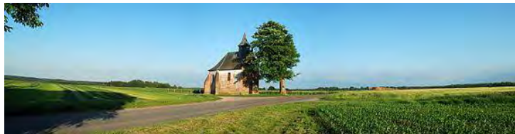
Photo Wikipedia avant la tempête de 2010 qui abattit l'érable sycomore

L'importance du site (deux monuments et une superficie de 75 hectares) a été consacrée lors de son classement par la Commission des Monuments et Sites en date du 1 er septembre 1997. Notons que ce classement est intervenu suite à une tentative de spéculation immobilière (déjà !).