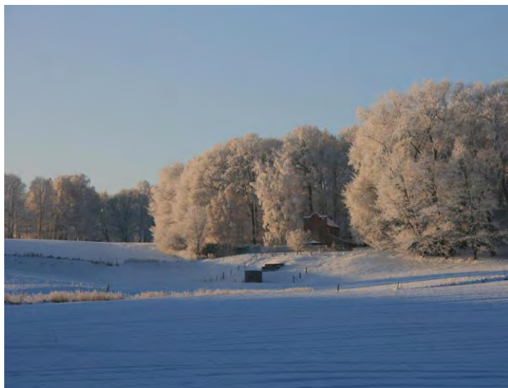
captage et chapelle d'Arichot (rue. du Château)

- le 100 e anniversaire de la canalisation de la source d'Arichot et de la distribution d'eau potable.